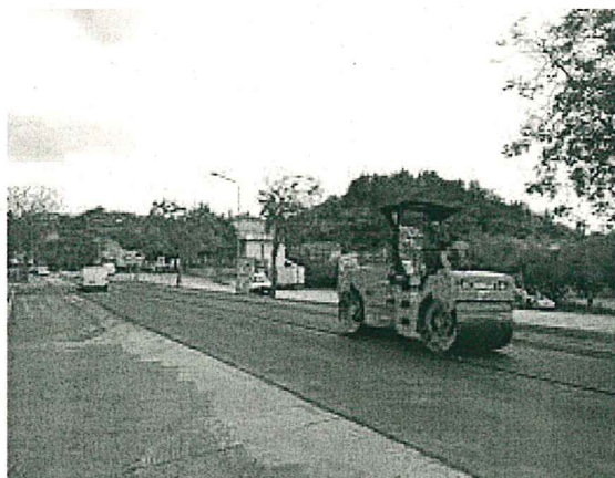
Rifacimento manti stradali