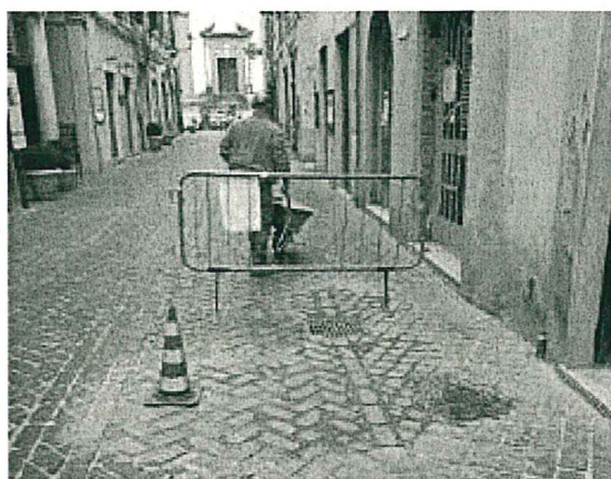
Ripristino pavimentazioni stradali