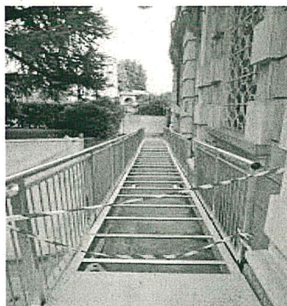
Rampe per disabili