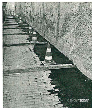
Ripristino impianti fognari

Detti lavori interesseranno, sulla base delle criticità di volta in volta riscontrate in termini di interventi non programmabili, i sedimi stradali inseriti nell'elenco allegato (strade,