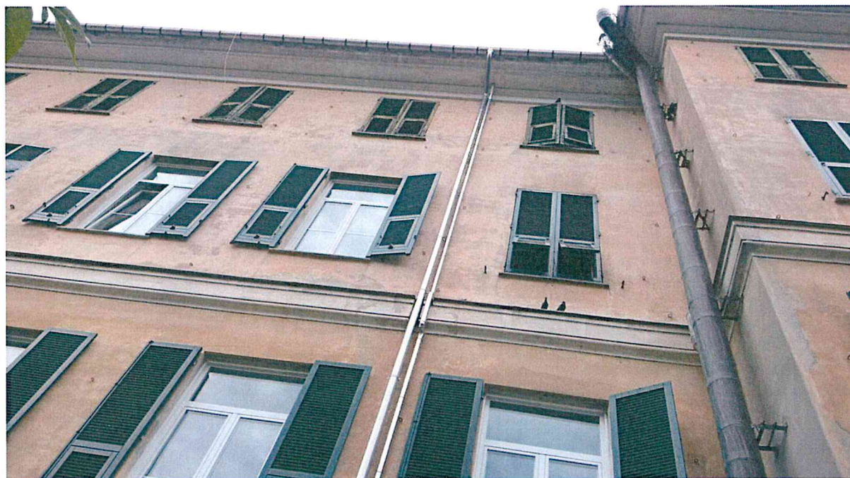
Foto 20,21 e 22 –prospetto principale, corpo centrale dove al piano terra è collocata la centrale termica. Dettaglio dell'angolo tra corpo centrale e l'ala ovest utilizzata dalla scuola, in questa ala sono già stati sostituiti pluviali e gronda

COMUNE DI GENOVA- DIREZIONE PROGETTAZIONE