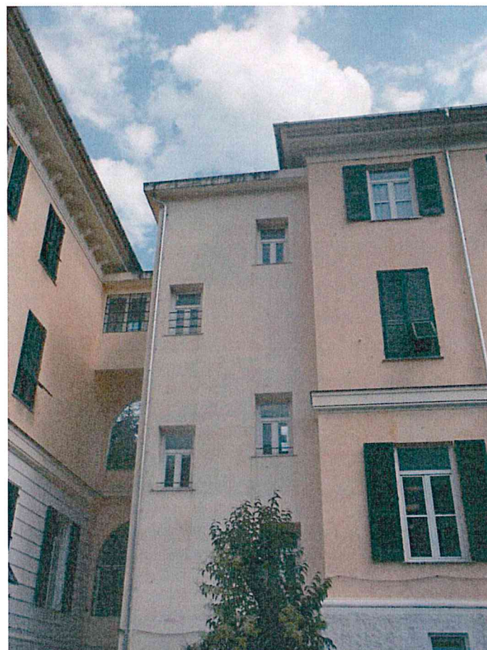
Foto 28-29 – immagini dell'edificio "gemello" del complesso posto a levante rispetto all'edificio centrale. In questo intervento lo stollato è stato esteso a tutto il piano terra fino al motivo decorativo marcapiano. Il corpo laterale rientrante è stato colorato con tono più chiaro.