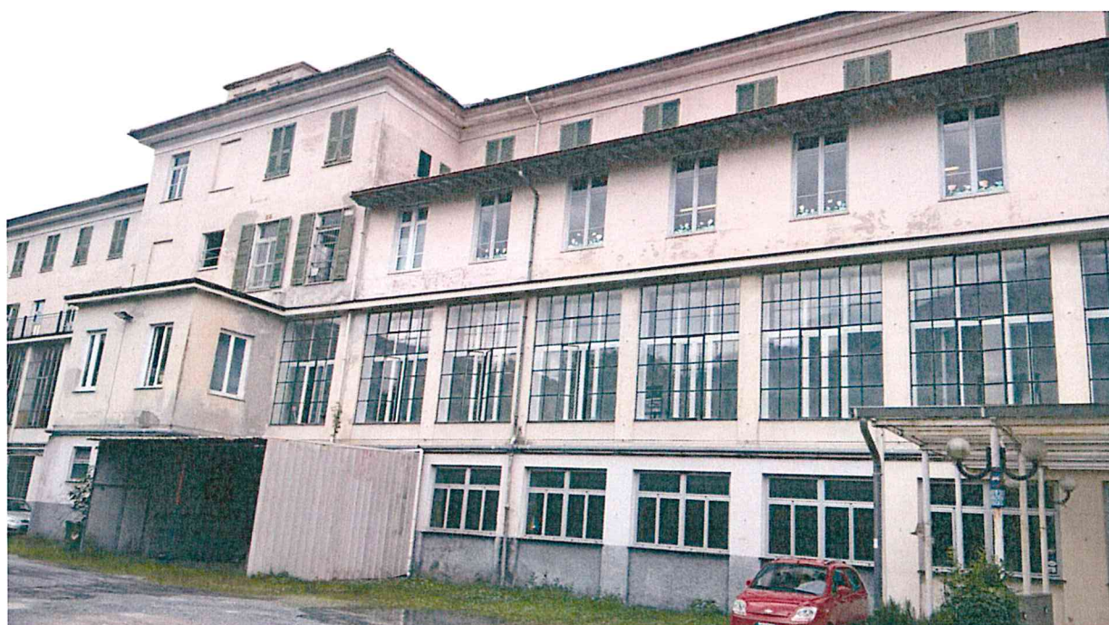
Foto 37-38- Prospetto nord: primo piano l'ala occidentale con le vetrate restaurate e i nuovi serramenti interni, sullo sfondo verso sinistra l'ala orientale con le otto vetrate oggetto del presente intervento