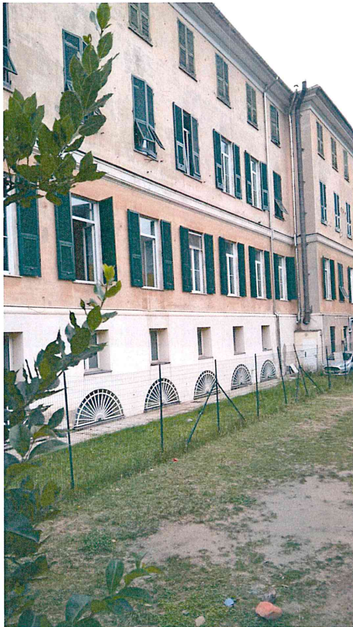
Foto 3 e 4 – Vista dell'ala laterale verso ovest del prospetto principale: si tratta della porzione adibita ad edificio scolastico ed interessata al piano terra da un precedente intervento

COMUNE DI GENOVA- DIREZIONE PROGETTAZIONE