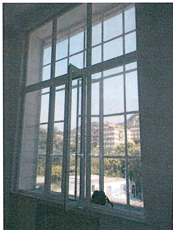
Foto 36- 37: Prospetto nord: (36) interno vetrate al primo piano dell'ala orientale collegata alla scuola, sulla destra(37) interno delle vetrate e del nuovo serramento nell'ala occidentale scolastica

COMUNE DI GENOVA – DIREZIONE PROGETTAZIONE