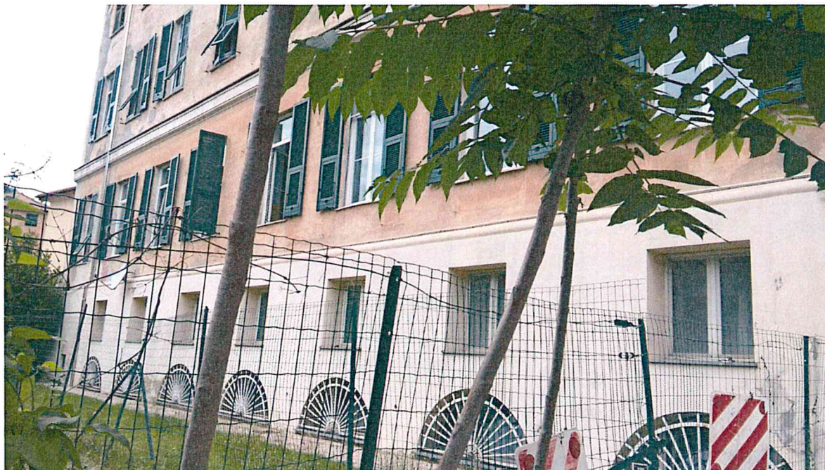
Foto 5 e 6 – dettagli ala ovest del prospetto principale, nella foto sottostante si vedono le porzioni di intonaco distaccate poi interessate da ripristini ed il corpo laterale sud all'interno del quale è collocato il vano scala di accesso alla scuola