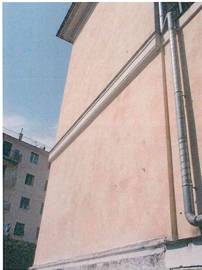
Foto 30-31 –dettagli dell'edificio gemello ristrutturato dalla Asl, sulla sinistra angolo tra corpo centrale aggettante e ala laterale est, sulla destra il prospetto laterale di levante.