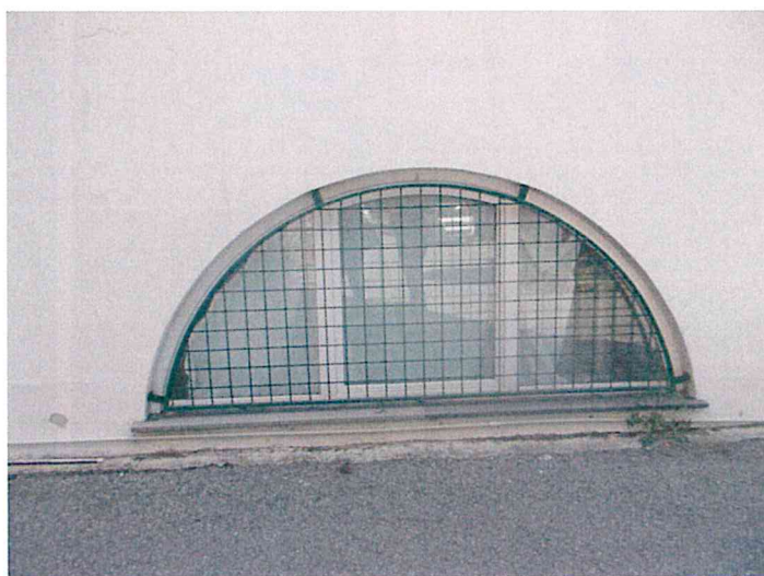
Foto 32-33 –sopra dettaglio dei serramenti semicirculari del piano terra del prospetto principale oggetto di intervento, sotto il nuovo serramento che verrà posizionato come quelli già utilizzati nell'ambito della ristrutturazione del complesso ASL

COMUNE DI GENOVA – DIREZIONE PROGETTAZIONE