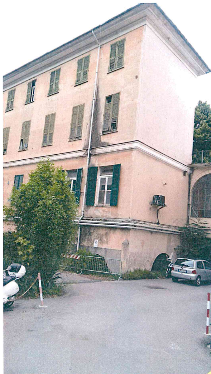
Foto 11-12– ala laterale est-angolo verso prospetto laterale orientale e verso collegamento con corpo centrale Asl del complesso

COMUNE DI GENOVA- DIREZIONE PROGETTAZIONE