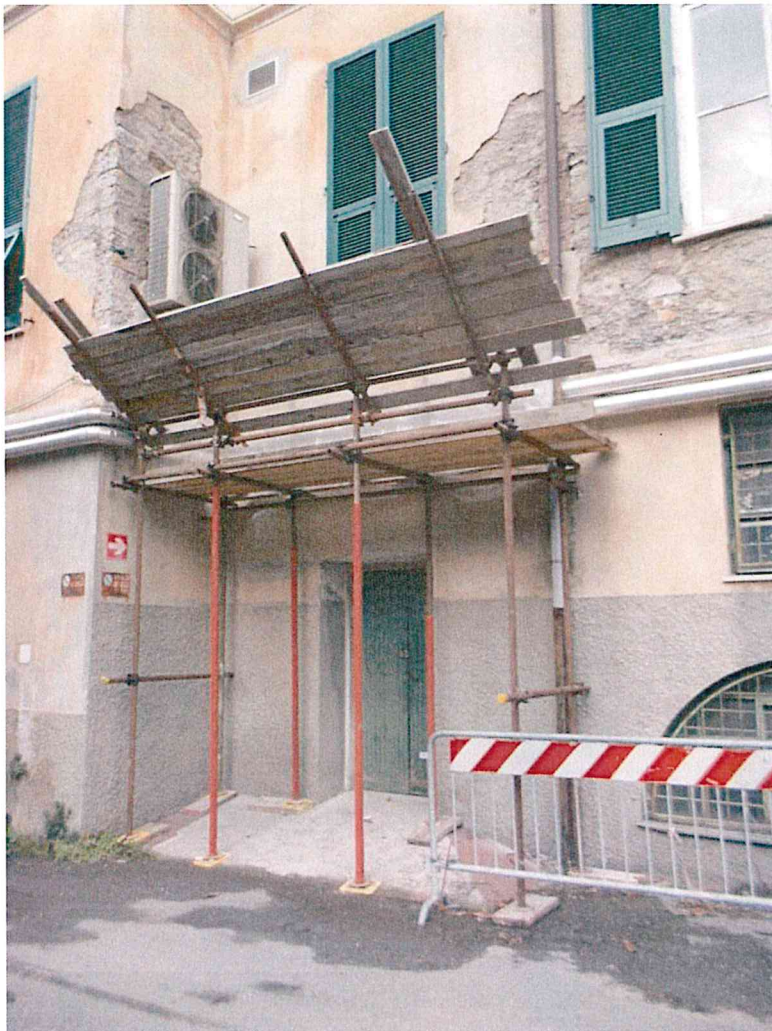
Foto 23,24 –prospetto principale, sopra angolo tra corpo centrale e ala est con mantovana sopra ingresso locali ad uso magazzino, nella foto sotto angolo tra corpo centrale e ala ovest scolastica con partenza canne fumarie impianto di riscaldamento