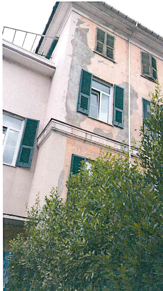
Foto 7-8 – ingresso della scuola in corrispondenza dell'angolo laterale sud-ovest