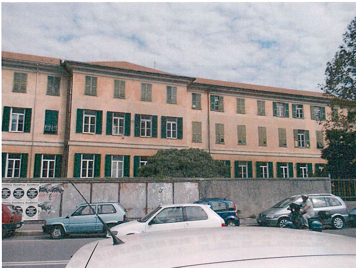
Foto 1 e 2 – Vista del prospetto principale da via Struppa con il corpo laterale in aggetto e sotto scorcio dell'intero prospetto dall'edificio centrale del complesso già oggetto di ristrutturazione da parte della ASL