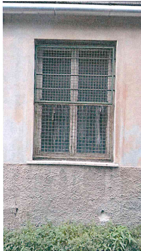
Foto 34 35—dettaglio serramenti esistenti del piano terra da sostituire o manutenzione (corpo centrale, locale caldaia)