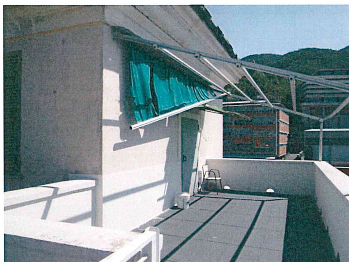
Foto 9-10 dettaglio dell'ingresso alla scuola e del terrazzo di copertura del corpo laterale ovest

COMUNE DI GENOVA- DIREZIONE PROGETTAZIONE