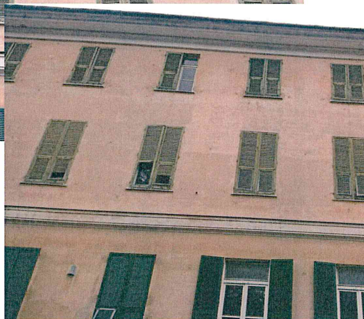
Foto 17,18 e 19 –dettagli del prospetto principale, ala laterale verso est, in questa parte di edificio il piano primo è in parte utilizzato dalla scuola, mentre il piano primo e secondo sono in disuso

COMUNE DI GENOVA- DIREZIONE PROGETTAZIONE