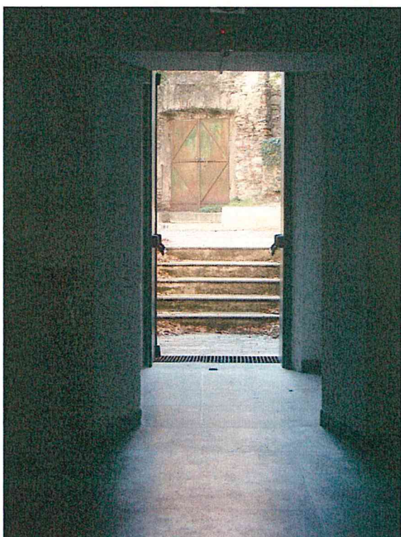
Foto 11 – Locali a piano terra in prossimità della zona di inserimento della piattaforma elevatrice