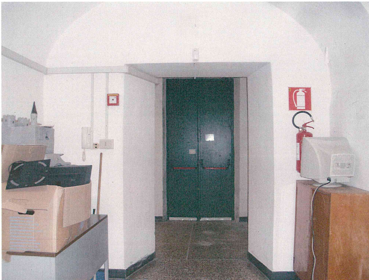
Foto 12 – Locali a piano terra in prossimità della zona di inserimento della piattaforma elevatrice

Handwritten signature of Rosanna Tartaglino in blue ink.