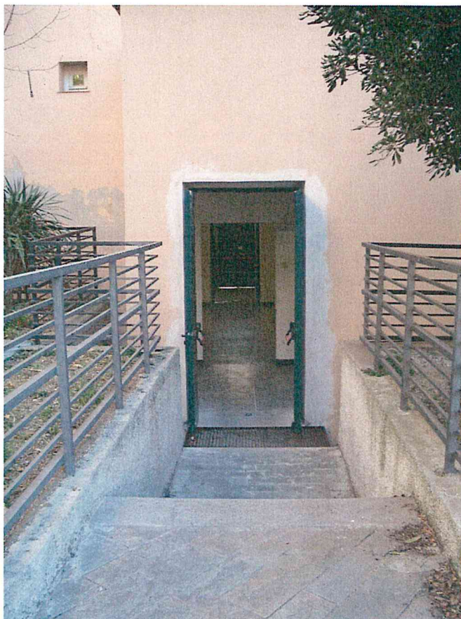
Foto 9 – Particolare Prospetto Sud: portone di ingresso alla scuola/uscita di sicurezza