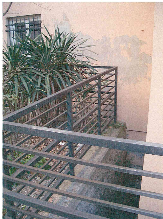
Foto 10 – Particolare ringhiera esterna in prossimità secondario dell'intercapedine che corre lungo l'edificio