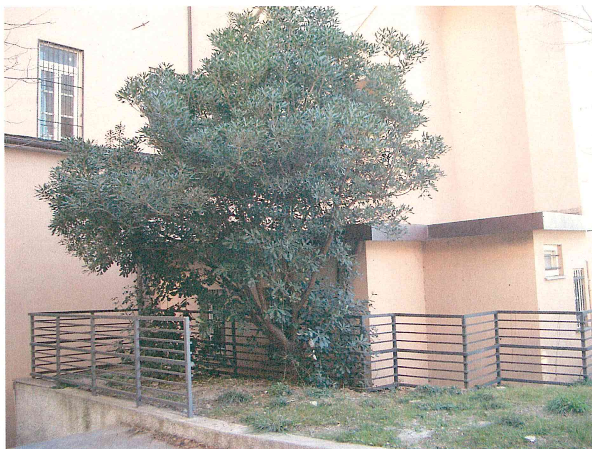
Foto 7 – Particolare aiuola da risagomare per l'inserimento della nuova rampa. Il pitosforo dovrà essere ricollocato come da elaborati grafici