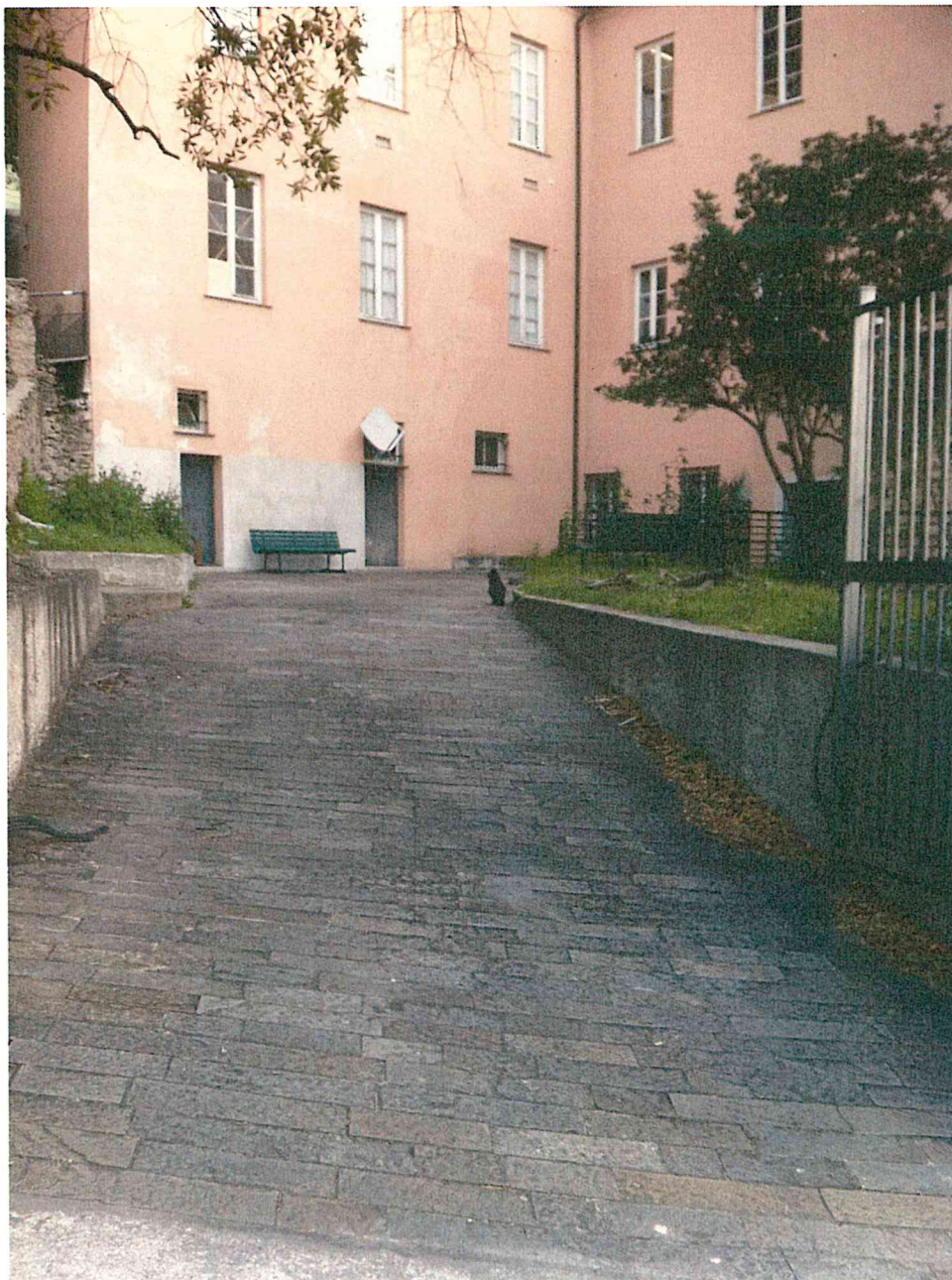
Foto 3- particolare rampa di accesso carrabile