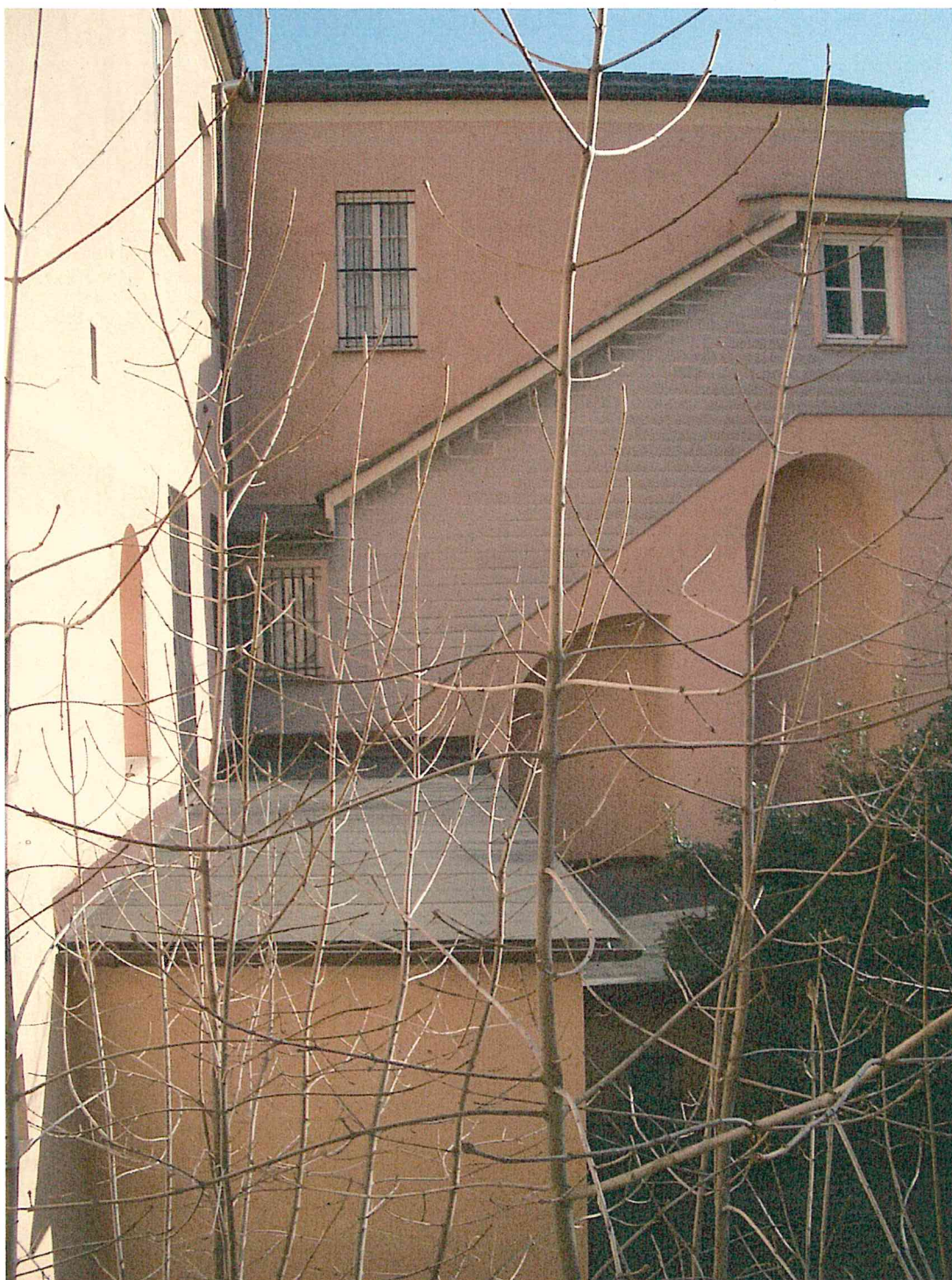
Foto 8 – scorcio sulla copertura del blocco bagni – l'area verrà resa calpestabile e servirà da sbarco a piano primo per l'elevatore