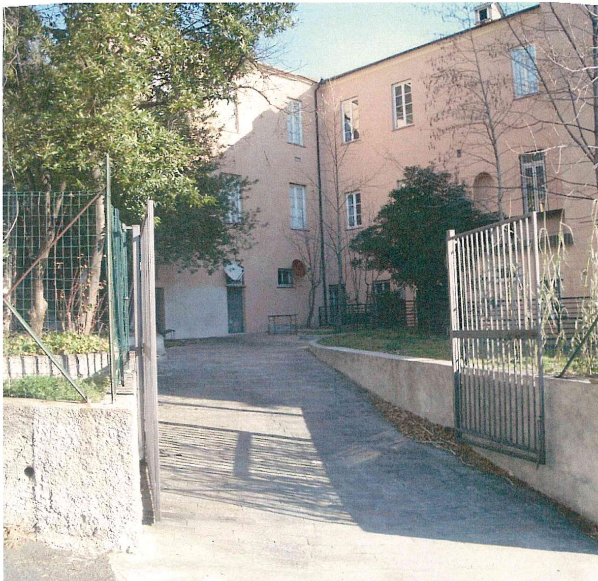
Foto 2- Accesso secondario alla Scuola Media Ansaldo