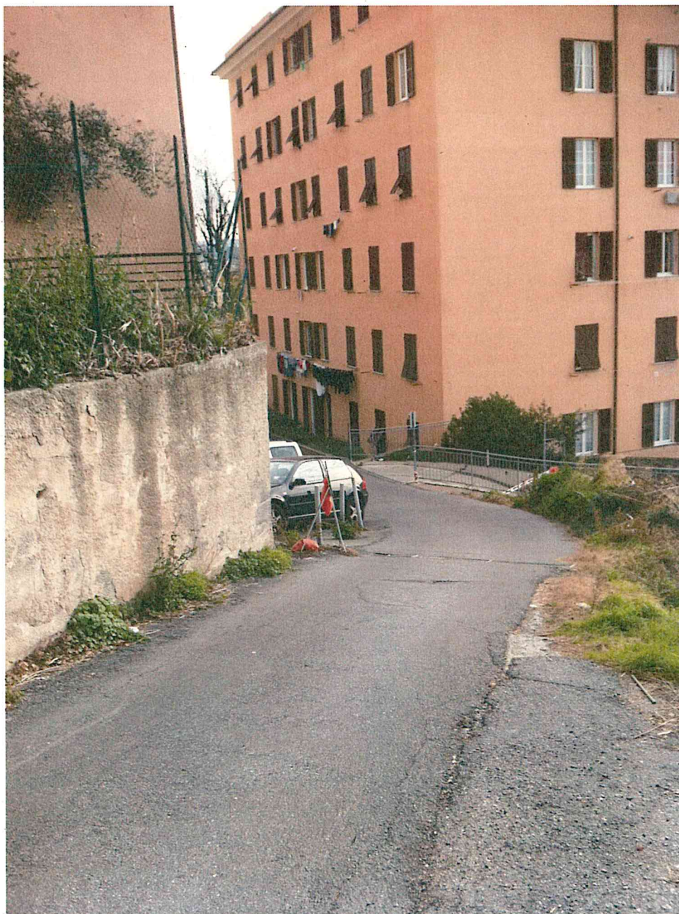
Foto 1- ultimo tratto di Salita Egeo, in prossimità del cancello di ingresso secondario alla Scuola Media Ansaldo. Si noti la forte pendenza della strada asfaltata