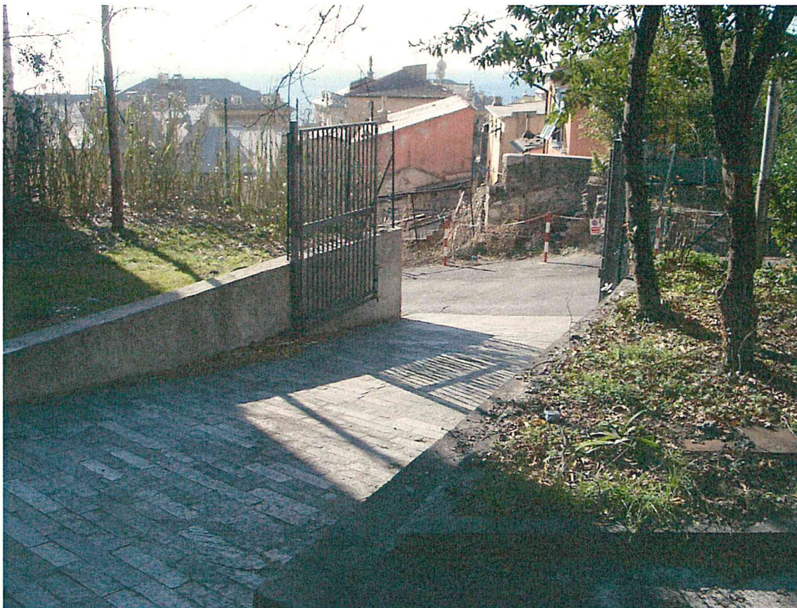
Foto 4- particolare rampa di accesso carrabile