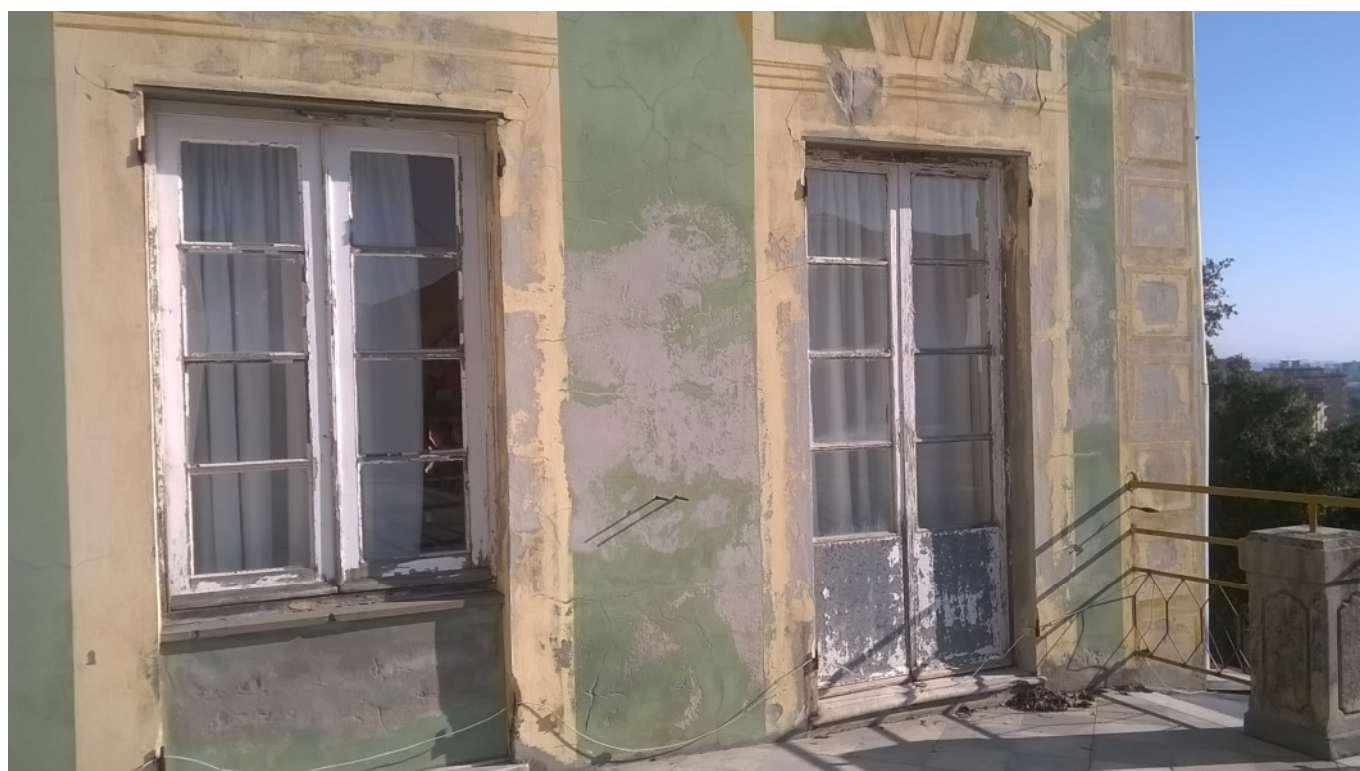
Figura 1: esempio di finestre esistenti in forte stato di degrado

Le finestre in particolare sono costituite in gran parte da vetusto telaio in legno e spazio vetrato realizzati con semplici vetri, carenti in molti casi della relativa stuccatura di fissaggio con potenziale pericolo di caduta. Inoltre non rispondono più alle odierne esigenze di isolamento con conseguente notevole dispersione dal punto di vista termico e acustico. Le persiane, ove presenti, sono per lo più in legno, con molte parti fatiscenti che possono portare in alcuni casi al distacco delle alette dagli sportelli con potenziale pericolo di caduta