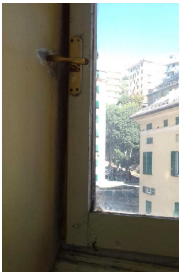
Figura 3: esempio di ferramenta