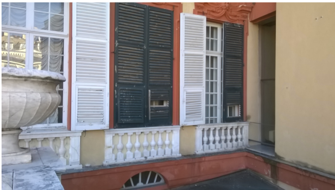
Figura 2: Esempio di persiane in forte stato di degrado