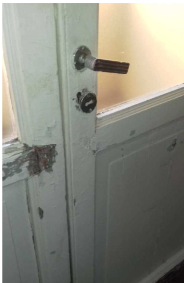
Figura 4: esempio di porta interna