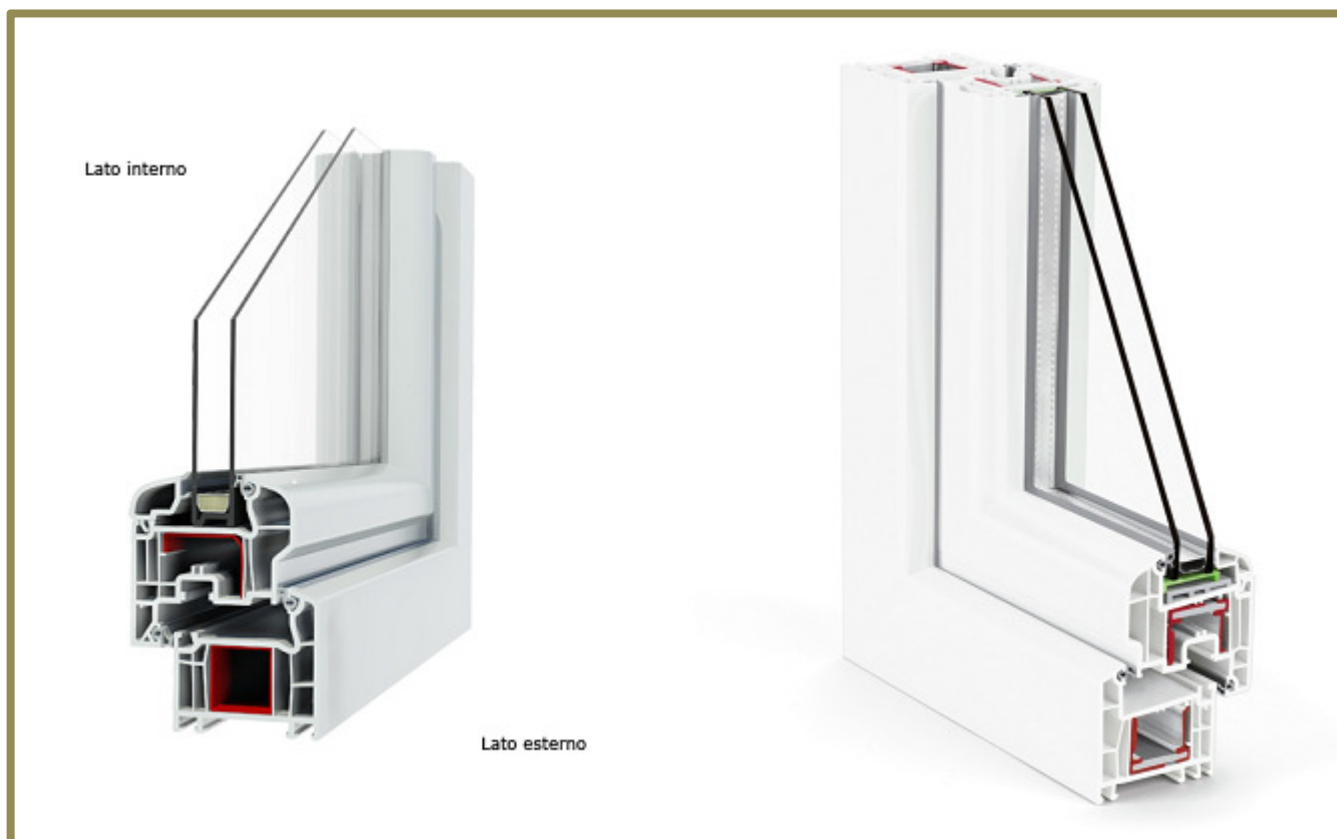
Figura 7: Esempio spaccato serramento in PVC

Per le lavorazioni di cui agli interventi precedentemente indicati, saranno applicati i relativi prezzi nel vigente “Prezzario Regionale per le opere edili e impiantistiche” anno 2018 o stabiliti eventuali nuovi prezzi.